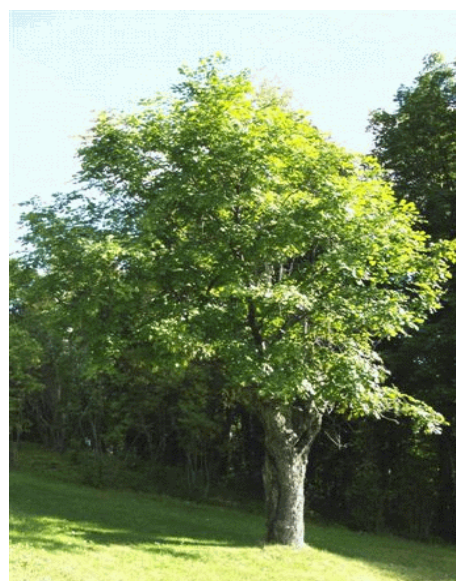
Le vieux Virgilier en août 2005

Le 3 juin à 9h00: Ouverture du Jardin français (remis au lendemain en cas de pluie)