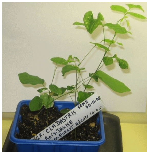
Les nouveaux plants de Virgilier le 7 mars 2006

Voici à droite la photo de la nouvelle génération de CLADASTRIS LUTEA (virgilier, bois jaune). Les graines récoltées en octobre 2005 ont été semées le 30 novembre 2005. Ils sont en culture sous néons chez Michel, à raison de 12 heures d'éclairage par jour. 50% des graines ont germé. Michel St-Pierre