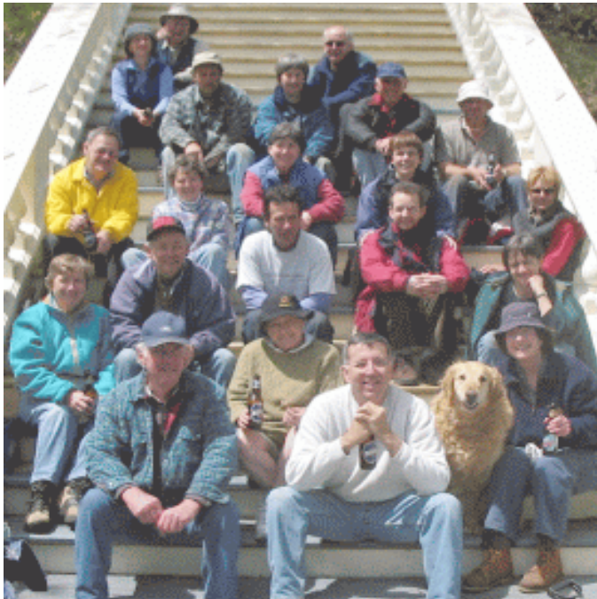
Le repos... après la corvée du printemps