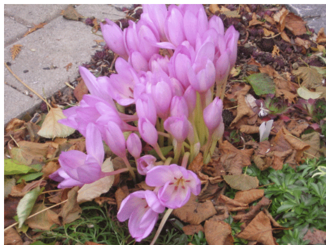
Colchicum pink giant