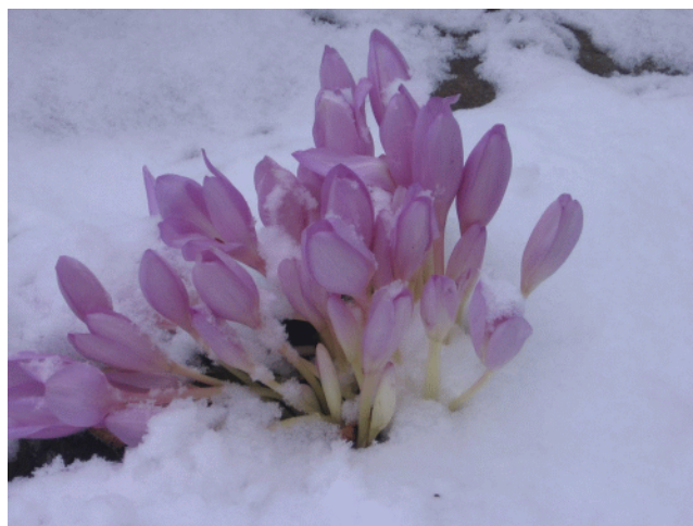
Colchicum pink giant dans la neige