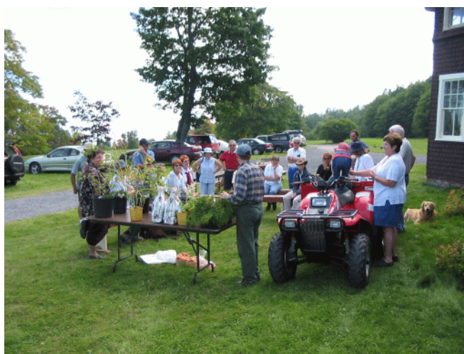
L'encan des vivaces

Réservation pour le souper/conférence du 24 janvier 2009 à 16h00.