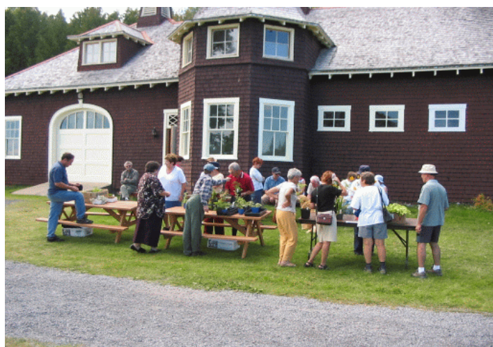
La vente des vivaces

La vente des vivaces et l'encan à l'extérieur au Domaine Forget le 14 septembre 2003